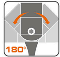
Douille articulée à 180°

Douille articulée à 180° pour une accessibilité maximale et un couple de serrage contenu Acier chrome vanadium traité suivant les Spécifications internationales Traitements spécial anti-corrosion